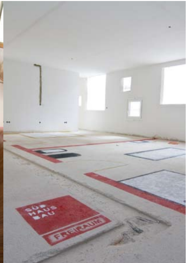
Auf der Rohbau-Vernissage waren Installationen von fünf hochkarätigen Ausstattungen zu sehen: Ludwigstraße 6 Die Küche, Kröncke, LOEWE Galerie Reisenberger, Waterfront Bathrooms und Lichtgalerie.