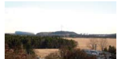
Die Alpen zum Greifen nah und die Allianz-Arena zu unseren Füßen – der Ausblick vom Dach eines Gebäudes in der Stösserstraße war atemberaubend. Gut zu erkennen waren die ungewöhnlich großen Abstände zwischen den einzelnen Gebäuden und die vielen Grünflächen des Viertels.