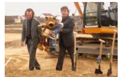
Spatenstich in Poing

rund 250.000 Quadratmeter Wohnfläche geschaffen. Mit der neuen Siedlung „Zauberwinkel“ soll diese erfolgreiche Ortsentwicklung nun fortgesetzt werden. Einen Blick zurück und nach vorne wirft Poing mit seinen Jubiläumsfeierlichkeiten vom 15. bis 19. Juli. Mehr dazu lesen Sie in unserer nächsten Ausgabe.