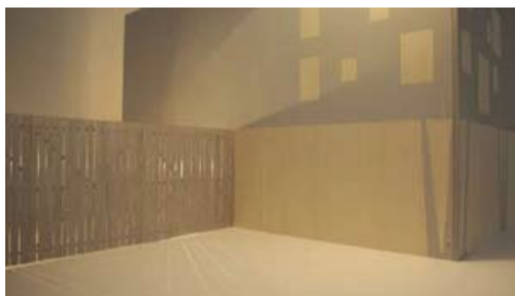
Motoko Dobashi „Ballons“ (rechts) Wandgemälde in der Liftkabine