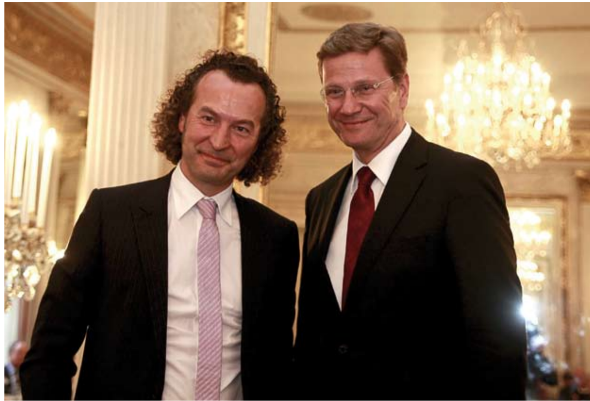
Dr. Guido Westerwelle zu Gast beim Wohnungswirtschaftlichen Arbeitskreis.