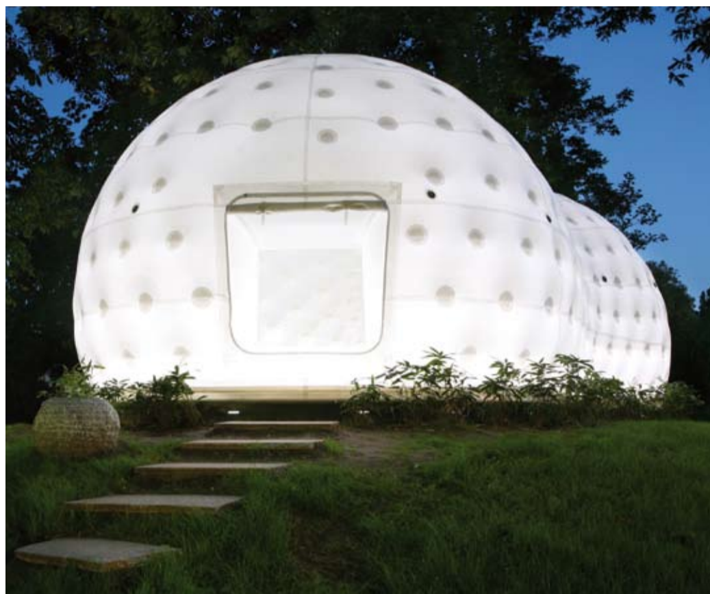
Wohnen in der Zukunft? Das Teehaus von Kengo Kuma

Um Visionen zu entwickeln, die letztendlich zu realen Vorhaben führen, müssen Entwicklungen, Trends und Tendenzen vor allem auch außerhalb des eigenen Wirkungskreises beobachtet und ein Gespür dafür entwickelt werden, wie z.B. neue ge-