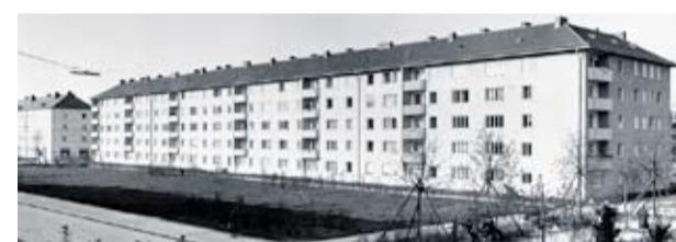
Wohnsiedlung, Perlacher Forst