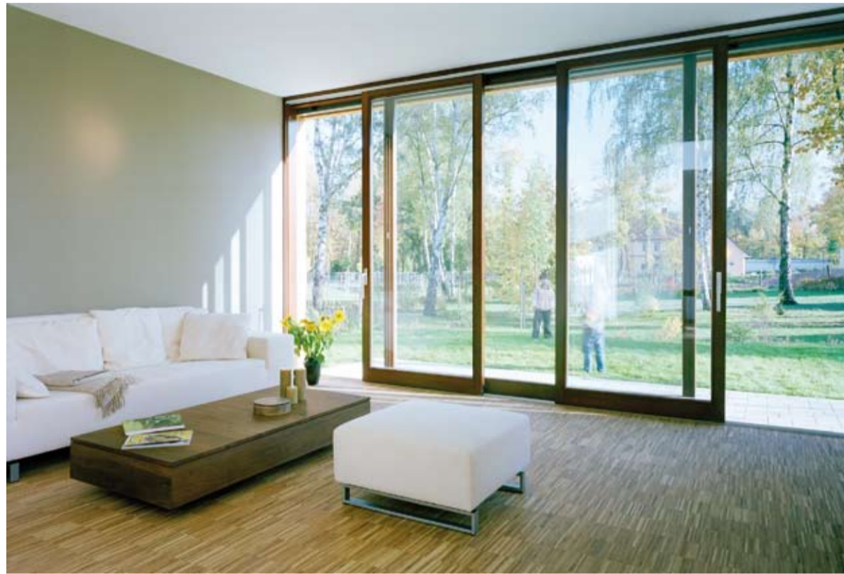
Unsere Projekte – zukunftsorientiert, nicht nur im Design, sondern auch als Vermögensanlage.