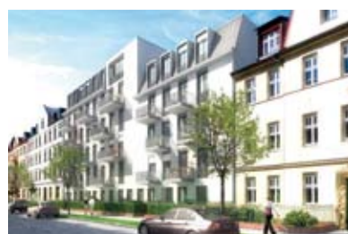
Siemensstraße in Potsdam

raum im Passivhausstandard. Die Neugestaltung der Außenanlagen tragen dabei wesentlich zur Wertsteigerung des Objektes bei und erhöhen die Wohn- und Lebensqualität der Bewohner.