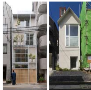
Weitere interessante Pet Houses der Architekten finden Sie unter: www.bow-wow.jp

Über den weiteren Verlauf des Projektes wird Sie die SÜDHAUSBAUnews auf dem Laufenden halten.