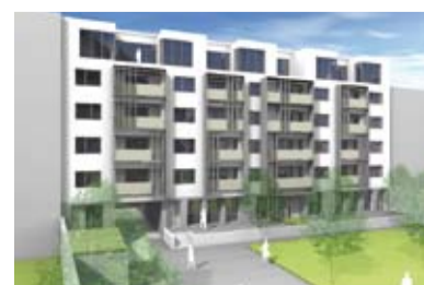
Urbanstraße in München