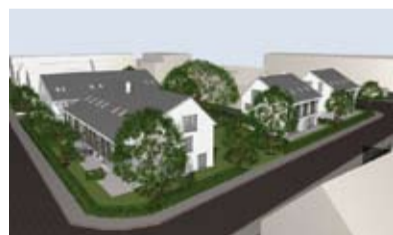
Gleißmüllerstraße in München

In der Münchener Gleißmüllerstraße betreut die Südhausbau Immobilienverwaltung ein Objekt für einen Fremdhauseigentümer, zu dem ein noch brachliegendes Grundstück gehört. Gemeinsam mit dem Eigentümer entwickelte Südhausbau auf diesem Areal eine Nachverdichtungsmaßnahme im Passivhausstandard.