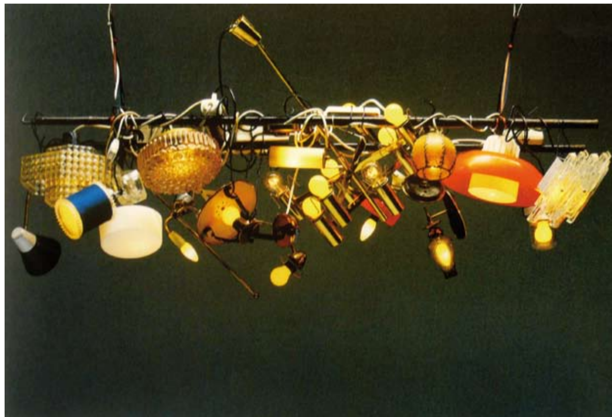
Lorenz Straßl: Untitled, 2011, metal, glass, plastic, cloth, light bulbs