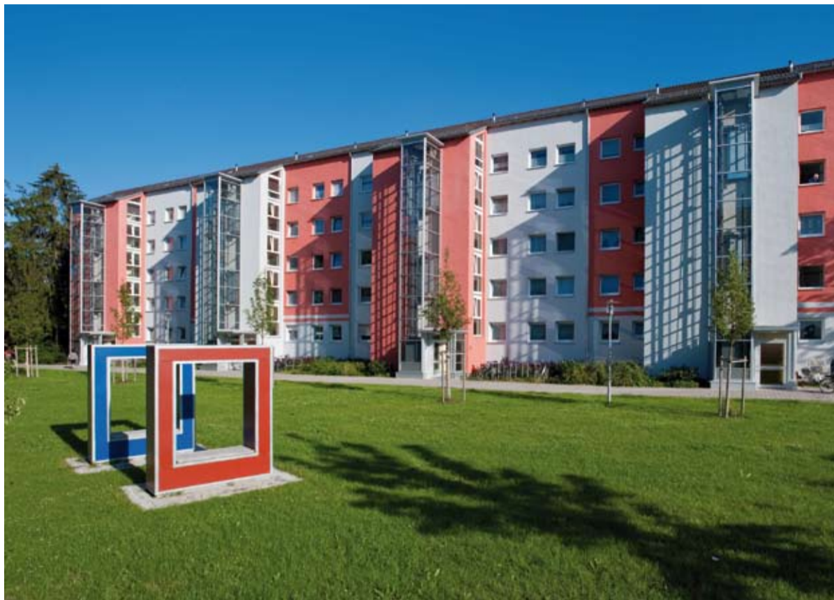
Südhausbau-Wohnungen im Ingolstädter Piusviertel.

Den Erfolg des gemeinsamen Projektes werden die Stadtväter und Minister Peter Ramsauer am 10. Oktober in einem Festakt offiziell würdigen. Darüber hinaus wird Südhausbau noch einmal im „familiären Kreis“ feiern. Alle Mieter der Rossinihöfe sind eingeladen, am 16. Oktober beim Südhausbau Mieterfest dabei zu sein.