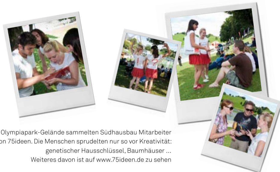
Auf dem Olympiapark-Gelände sammelten Südhausbau Mitarbeiter Vorschläge für die Aktion 75ideen. Die Menschen sprudelten nur so vor Kreativität: genetischer Hausschlüssel, Baumhäuser ... Weiteres davon ist auf www.75ideen.de zu sehen

Achtung: Anmeldeschluss verlängert bis 17.11.2011