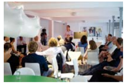
Wahrnehmung mit geschärften Sinnen und verblüffenden Erfahrungen – die Teilnehmer waren in jeder Hinsicht „begeistert“.