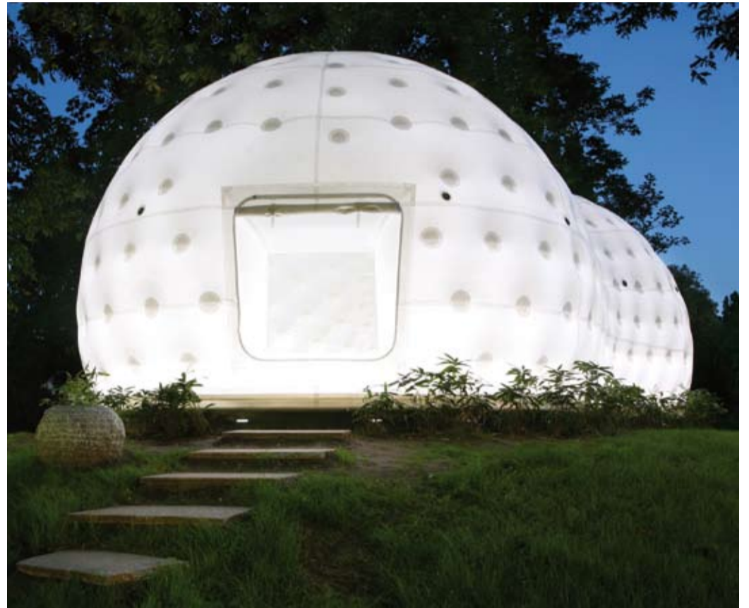
Wohnen in der Zukunft? Das Teehaus von Kengo Kuma

Jedes Unternehmen sollte eine Vision haben, eine Art Polarstern, dem das gesamte Unternehmen folgt und an dem sich alles Tun und Handeln ausrichtet. Solche Visionen sind wichtig, weil sie eine klare Richtung vorgeben. Eine Vision kann durchaus kühn und auch verwegen sein, ein wenig unerreichbar aber durchaus erstrebenswert. Ohne eine klare Vision wären viele Erfindungen und Errungenschaften, die wir heute als selbstverständlich erachten, niemals entstanden. Um Visionen zu entwickeln, die letztendlich zu realen Vorhaben führen, müssen Entwicklungen, Trends und Tendenzen vor allem auch außerhalb des eigenen Wirkungskreises beobachtet und ein Gespür dafür entwickelt werden, wie z.B. neue ge-