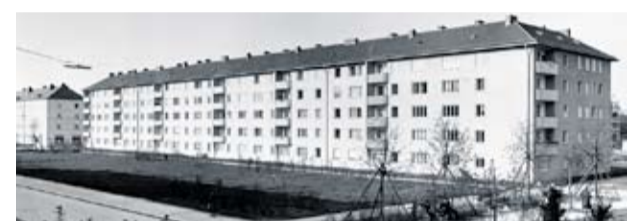
Wohnsiedlung, Perlacher Forst