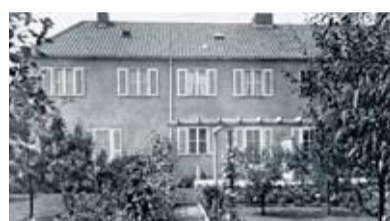
Am Staudengarten, Harlaching