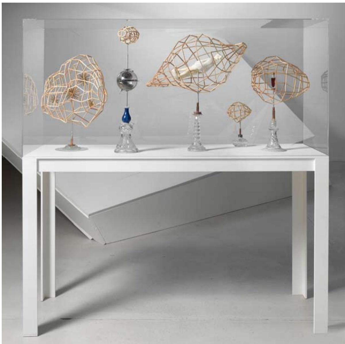
Die lokale Gruppe (Coma, Virgo, Sculptor), 2010, Foto: Roman März

Der Mensch ist aus der Natur hervorgegangen, er ist ein Resultat der kosmischen Gesetzmäßigkeiten und Ordnung. So betrachtet ist er ein Geschöpf des Kosmos. Das Wort „Poesie“ geht auf den Begriff des Erschaffens, des Schöpferischen zurück. Das Schöpferische ist der poetische Kern unserer Welt